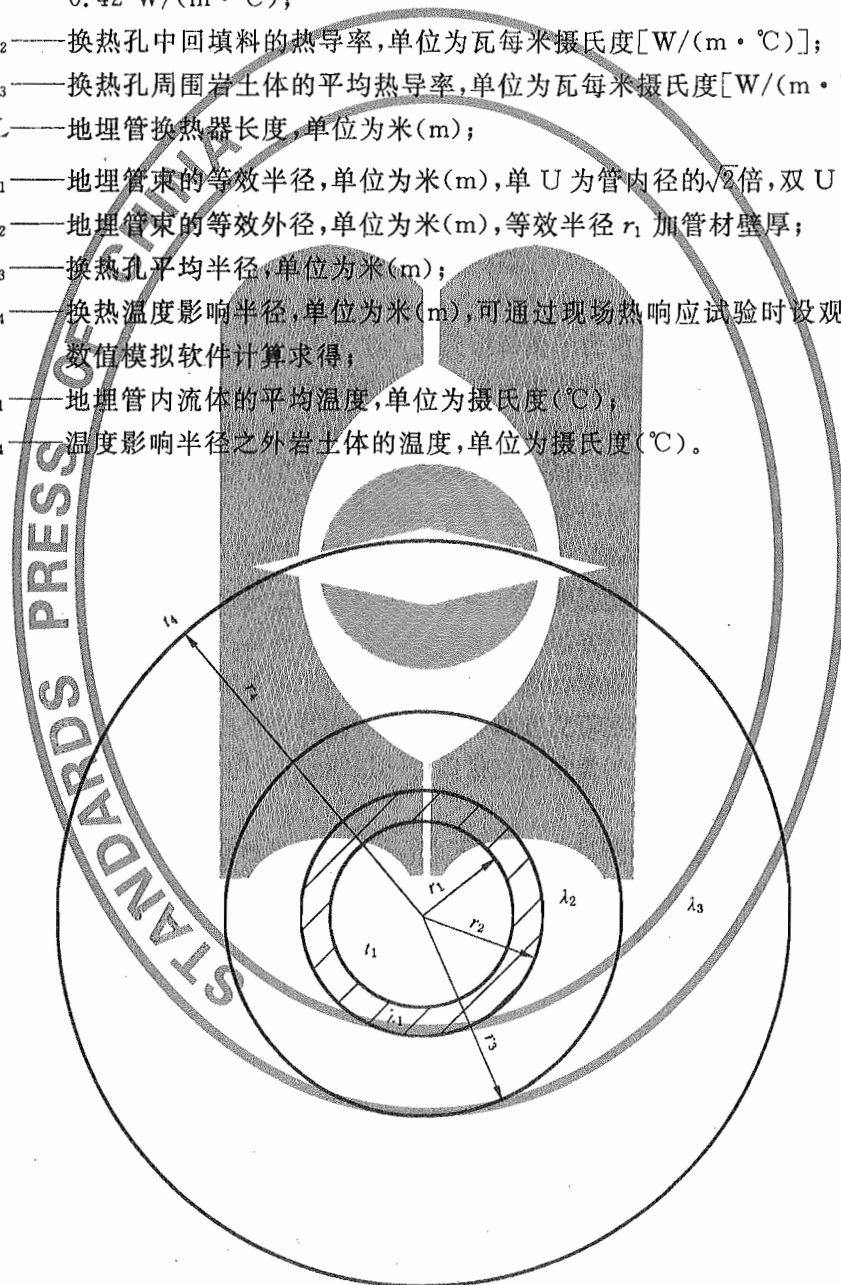
图 A.1 地埋管热功率计算示意图